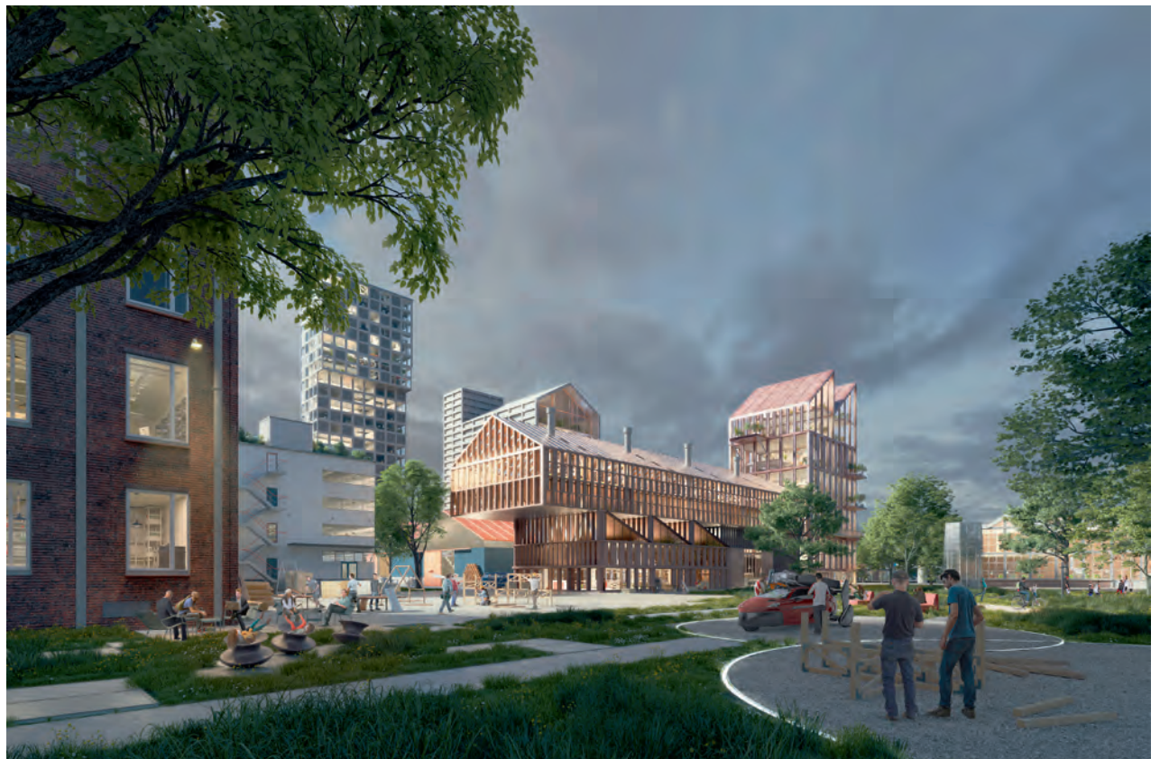
Impressie van het veld en makershof in het Vierhavensblok Impression of the field and makers courtyard in the Vierhavensblok

Wim van den Bergh: If I look at the plans, I would try to mix to the max. Normally these developments start small, so they have the possibility to grow. It also depends on the density you are aiming for: with higher density there will be a com-